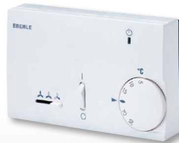
KLR-E 525 52 hp