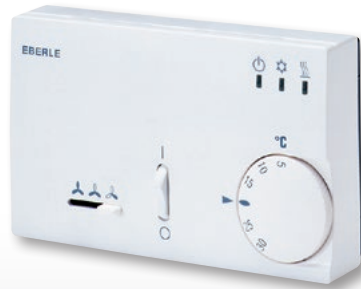
KLR-E 525 52 4p

AC controller for residential and office applications