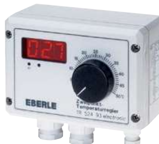
TR 524 93