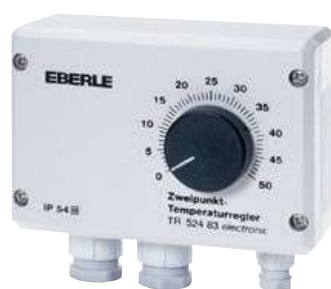
TR 524 83