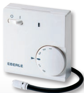
FR-E 525 31

Floor Heating Controller – with remote sensor