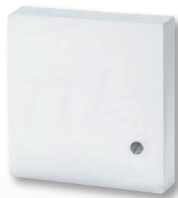
F 190 021