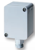
Fühler für Außenmontage Sensor for outdoor mounting