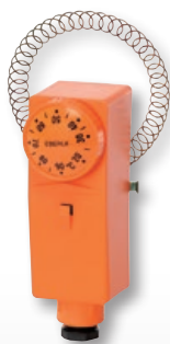
RAR 875 01