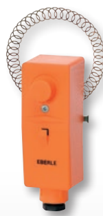
RAR 875 02