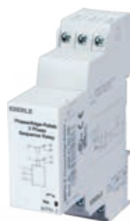
WPH-2 (Abbildung ähnlich)